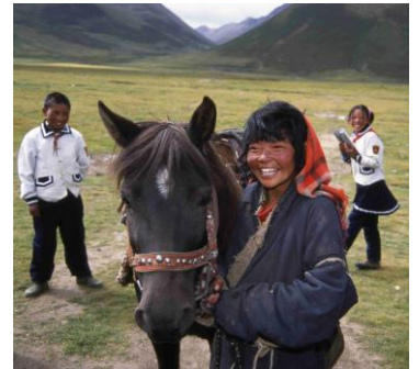
馬に乗り 7 時間かけて学校へ